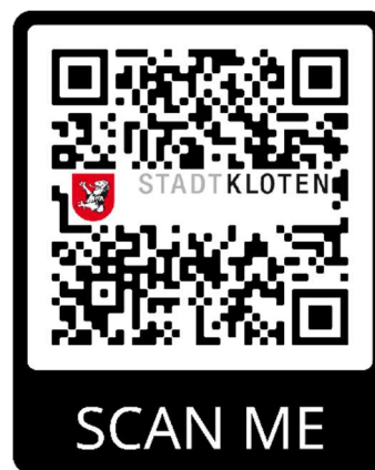
QR-Code zur Informationsplattform